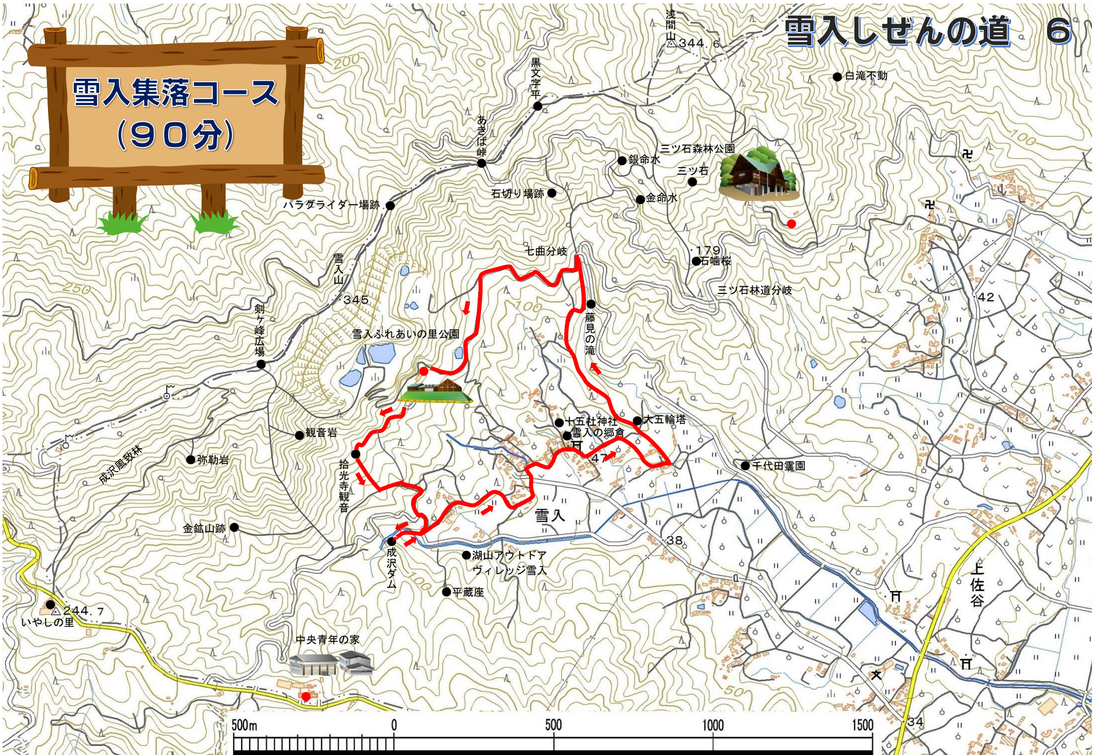
この地図は、国土地理院電子地形図 25000 を加工して作成したものである。