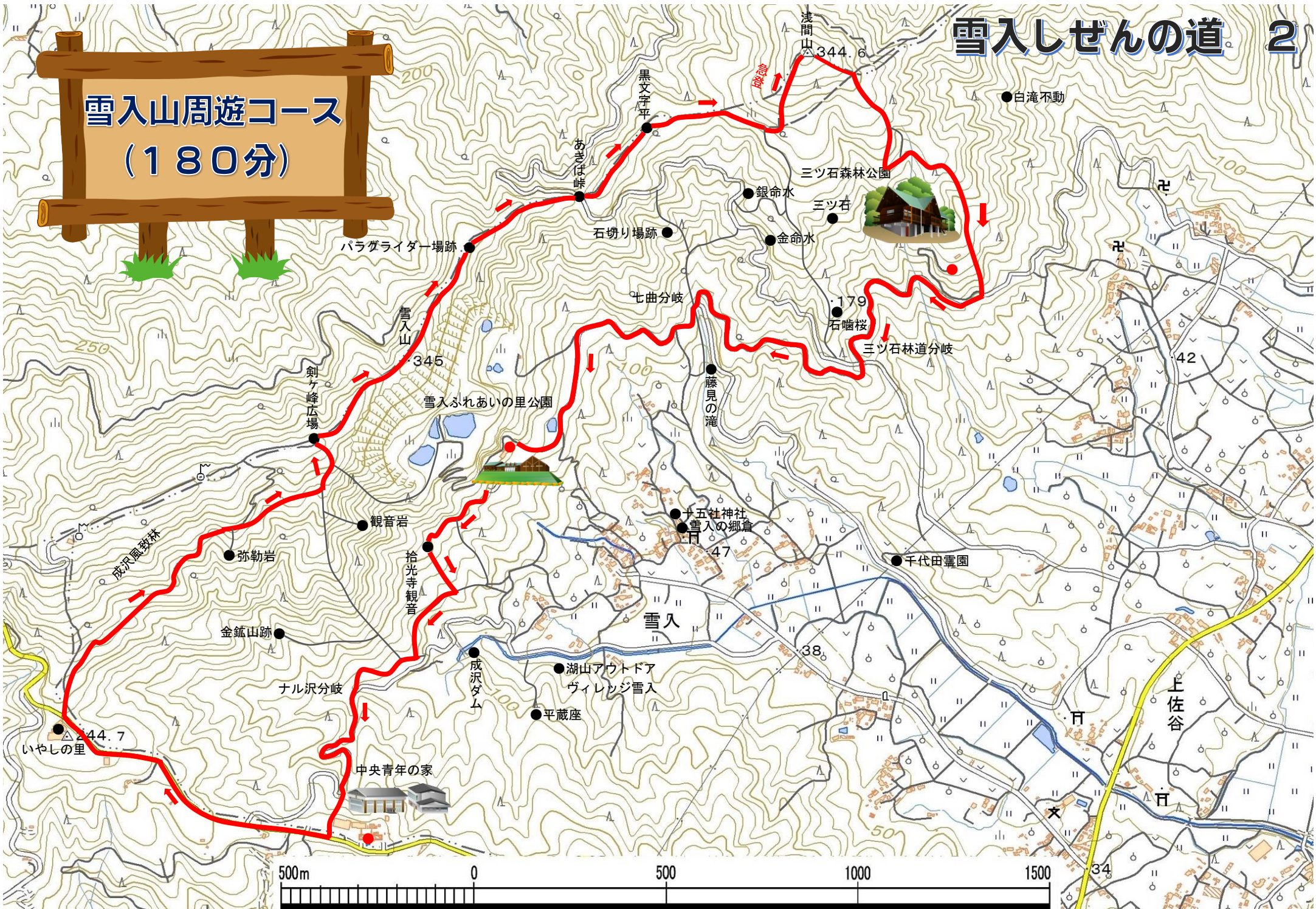
この地図は、国土地理院電子地形図 25000 を加工して作成したものである。